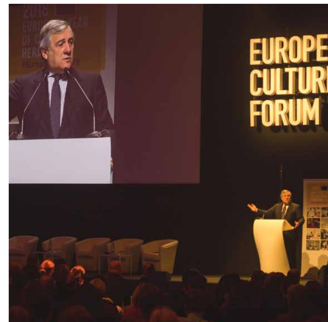
Antonio Tajani, Presidente del Parlamento Europeo.

Dall'alto: Jean-Claude Juncker, Presidente della Commissione Europea; Dario Franceschini, Ministro dei Beni e delle Attività Culturali e del Turismo; Giuseppe Sala, Sindaco di Milano; la sala conferenza gremita durante l'intervento di Tibor Navracsics, Commissario Europeo per l'Istruzione la Cultura la Gioventù e lo Sport; panoramica dell'esposizione sul tema del Patrimonio Culturale mondiale; un momento di relax con il ballo finale; il ledwall di Superstudio per la comunicazione dell'evento all'esterno.