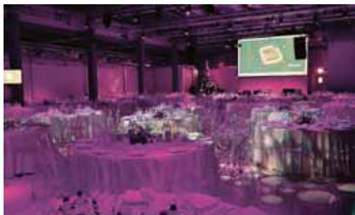
Cene di Natale al Superstudio Più.