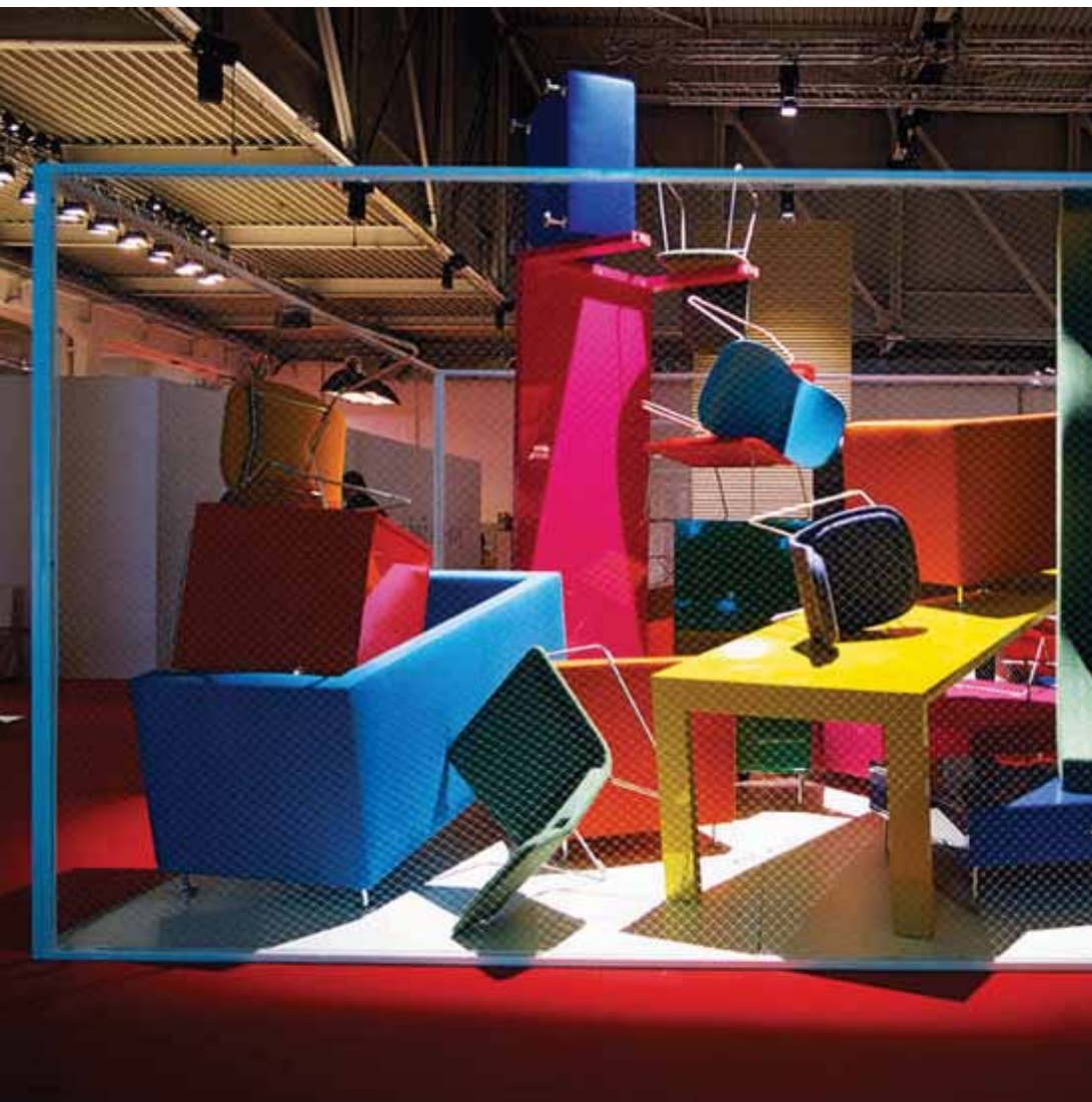
Anno 2000: installazione di Cappellini al Superstudio Più.